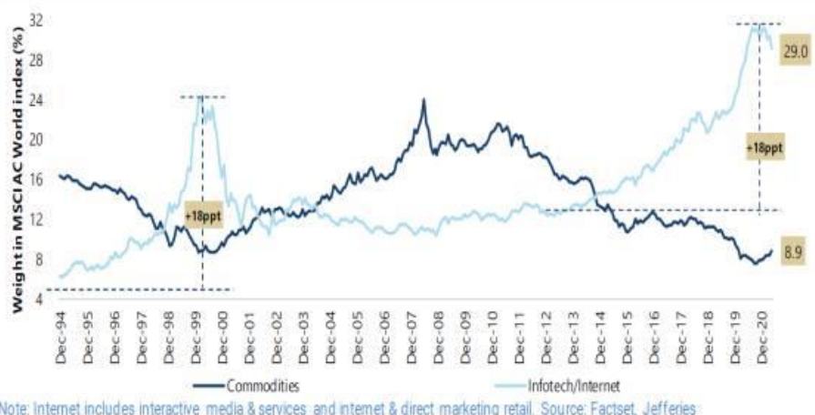
Exhibit 2: MSCI AC World - Tech/internet and commodities sector weight trend since 1995