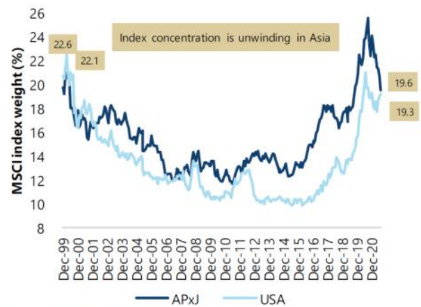
Kuva 2: Isojen indeksi-yhtiöiden osuuden pieneneminen indekseissä voi hyvinkin vielä jatkua, kun kilpailukenttää tehdään reilummaksi useammille yhtiöille (Kiinan ”common prosperity” -teema) ja karsitaan isojen yhtiöiden monopolimaista asemaa.

Ottaen huomioon yllä olevan, paranevan tilanteen koronan suhteen lähes kaikissa kohdemaissamme (etenkin parhaillaan Indonesiassa) ja sen, että useammalla eri sijoittajataholla pienempien Aasian maiden painot ovat olleet historiallisen alhaisilla tasoilla viime vuosina, nämä syksyn pohjoistuulet saattavat hyvinkin olla suotuisia Kaakkois- ja Etelä-Aasian pienemmille osakemarkkinoille. Allekirjoittaneella on ainakin kova usko siihen, että Aasian maiden eri indeksien suuret tuottoerot tulevat tasoittumaan loppuvuotta kohden ja mitä luultavimmin kääntymään päinvastaisiksi, kun vuosi 2022 on korkattu.