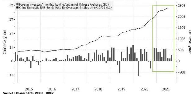
Kuva 1: Kiinan pääomamarkkinat ovat rakenteellisessa kasvussa länsimaisten sijoittajien salkuissa riippumatta regulaatiopäivityksistä.

Toisaalta isoja indeksipainojen muutoksia on ennenkin tapahtunut. Esimerkiksi Kiinan paino MSCI Asia (ex-Japan) -indeksissä vuonna 1996 oli vain 0,6 %, kun nykyään taso on n. 40 %. Lisäksi 1980-luvun lopulla indekseissä maailman suurimpana maana oli Japani, kun taas muun Aasian osakkeet olivat niin kovassa nosteessa vuoteen 1995 saakka, että esimerkiksi monien Britannian eläkesäätiöiden salkuissa Aasian (ilman Japania) alueen