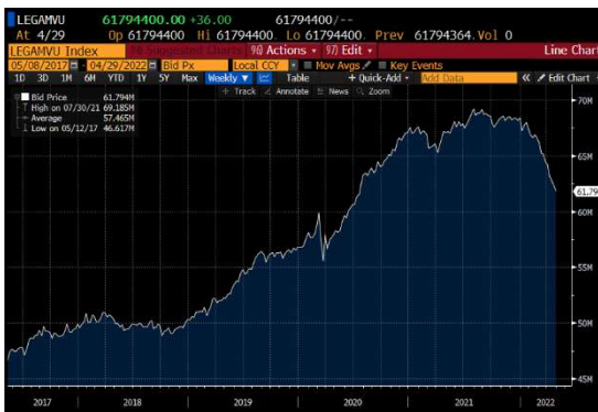
Globaalin bondimarkkinan kupla puhkeamassa vai tervehkinen korrektio?

Kokonaisuudessaan muuttujia maailman pääomamarkkinoilla on nyt useampia. Esimerkiksi Japanin keskuspankin YCC (yield curve control) eli pitkien korkojen pitäminen keinotekoisesti setelirahoituksen avulla 0,2 % tasolla ja jenin huomattava heikentyminen on saanut nyt Japanin vähentämään US Treasuryta (joiden suurin yksittäinen omistaja Japani on), jotta jenin laskeva arvo ei kiihdyttäisi inflaatiota.