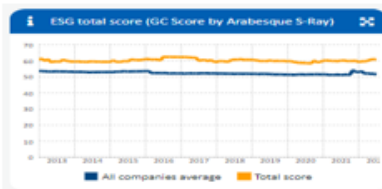
Kuva Salkku vs. kaikki yhtiöt ESG-kehitys